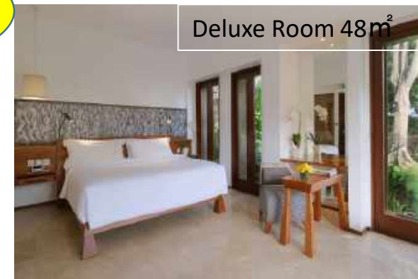
Deluxe Room 48m 2