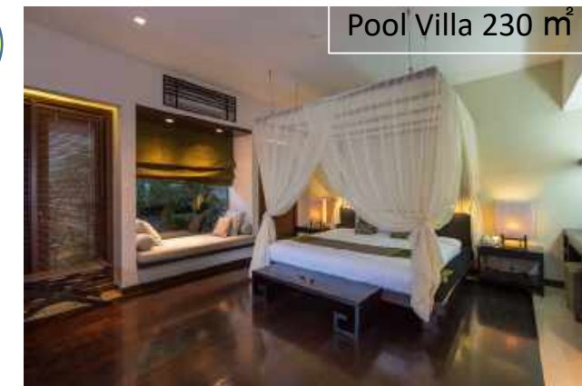
Pool Villa 230 m 2